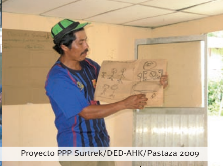
Proyecto PPP Surtrek/DED-AHK/Pastaza 2009