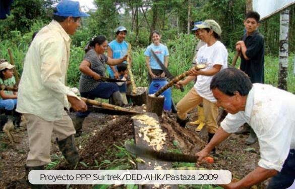
Proyecto PPP Surtrek/DED-AHK/Pastaza 2009