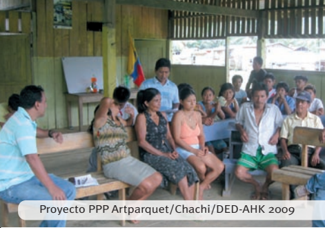
Proyecto PPP Artparquet/Chachi/DED-AHK 2009