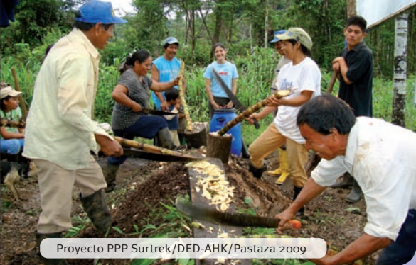
Proyecto PPP Surtrek/DED-AHK/Pastaza 2009